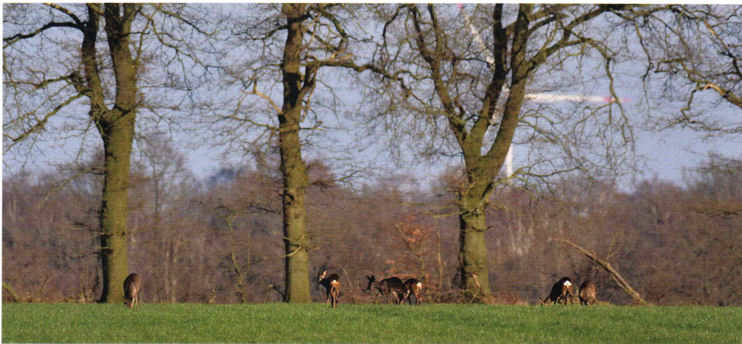
Altijd blijven opletten. Ook onderweg, als je van je veld naar huis rijdt. Zo zag ik vlak bij huis op een flinke afstand deze sprong van zes reeën. De derde van links is een zwart exemplaar